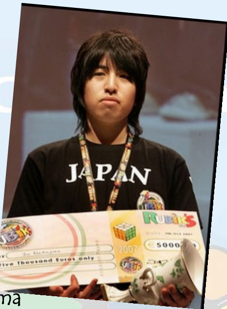
Yu Nakajima Campeón del mundo 3x3