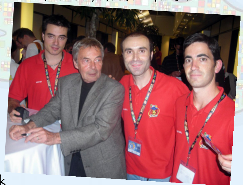
Equipo Español del Cubo de Rubik con Erno Rubik, inventor del Cubo